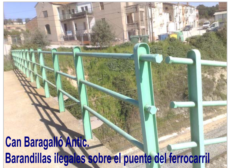
Can Baragalló Antic, Barandillas ilegales sobre el puente del ferrocarril