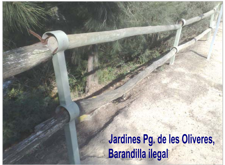
Jardines Pg. de les Oliveres, Barandilla ilegal