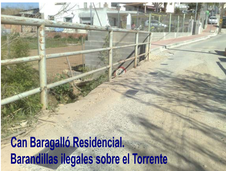
Can Baragalló Residencial, Barandillas ilegales sobre el Torrente