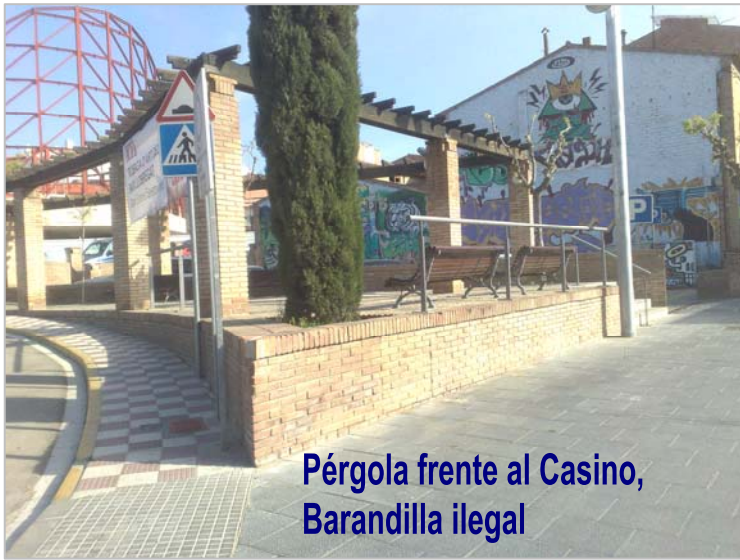
Pérgola frente al Casino, Barandilla ilegal