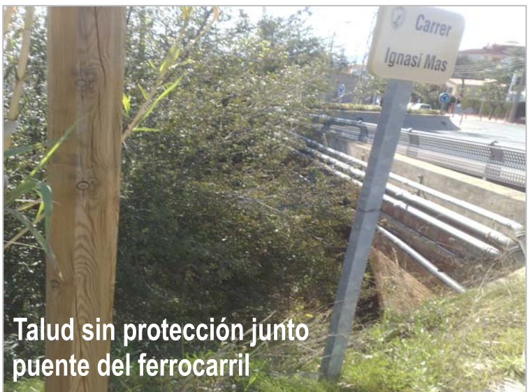
Talud sin protección junto puente del ferrocarril