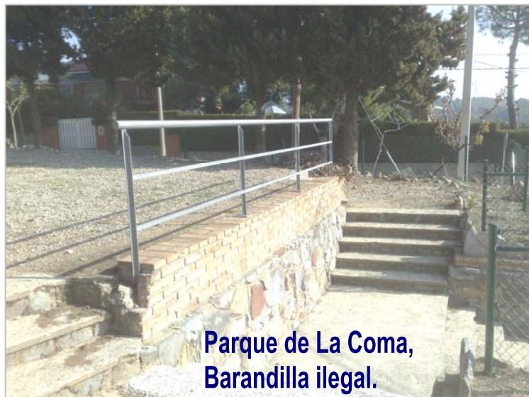
Parque de La Coma, Barandilla ilegal.