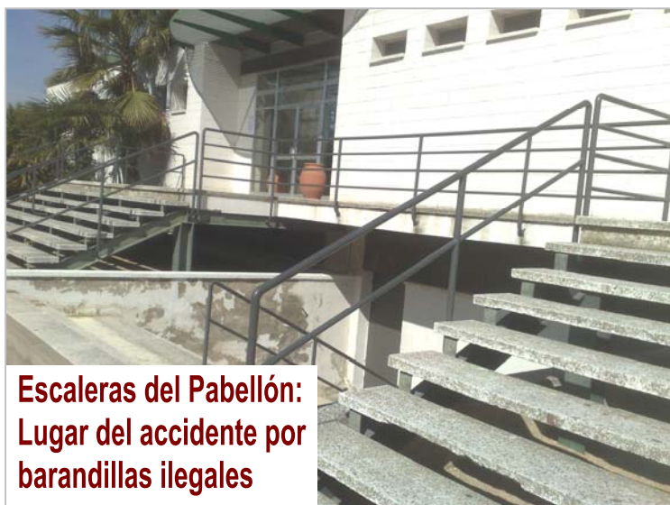
Escaleras del Pabellón: Lugar del accidente por barandillas ilegales

Ver fotografías de barandillas y espacios que están fuera de ley