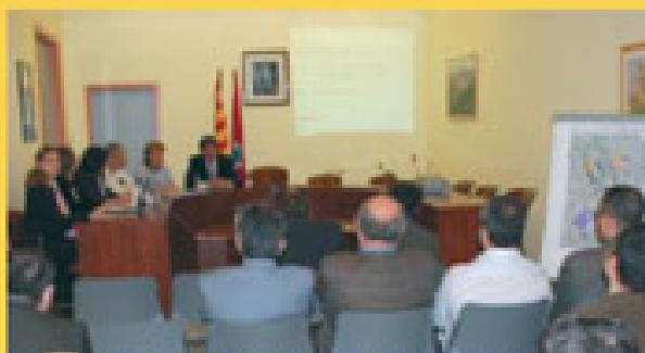
Sessió informativa del POUM adreçada a empresaris.

A partir de l'1 d'abril l'Ajuntament posa en marxa el programa de bonificació de quotes de la Seguretat Social. Per aquest motiu i coincidint amb la sessió sobre el POUM adreçada al sector empresarial del municipi, es va informar als assistents sobre les característiques d'aquesta iniciativa municipal.